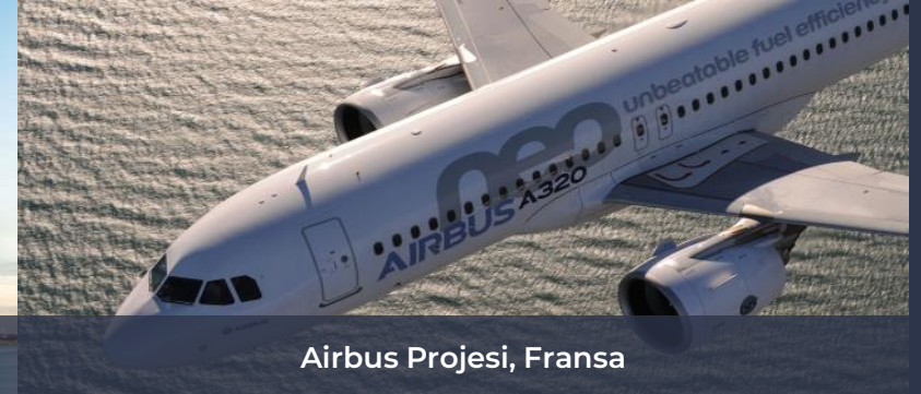
Airbus Projesi, Fransa