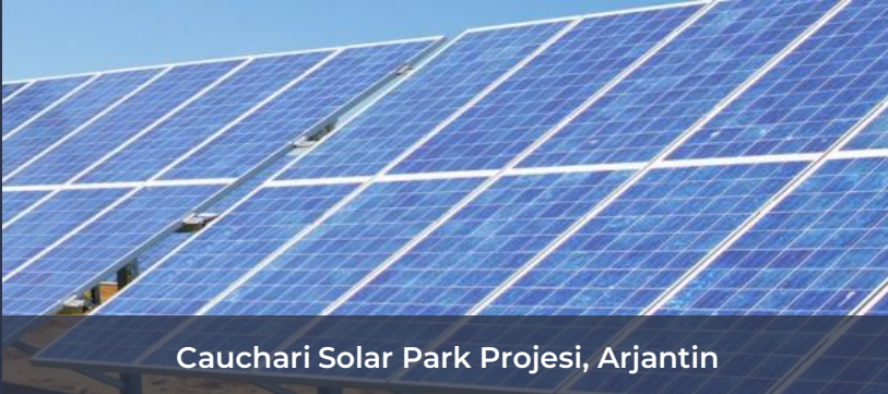
Cauchari Solar Park Projesi, Arjantin