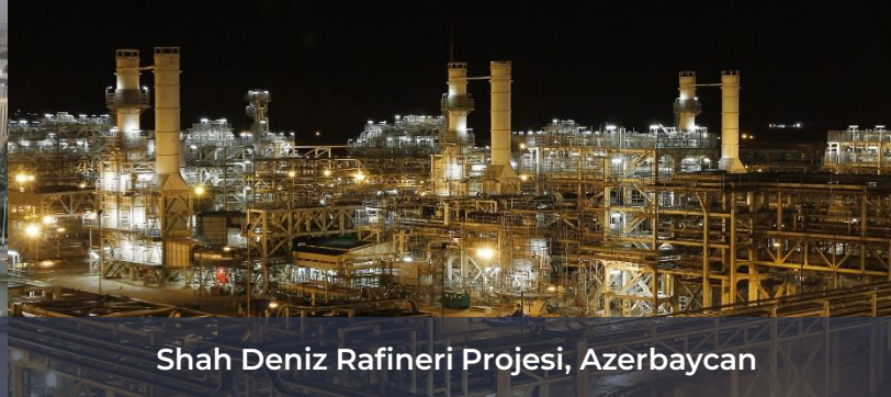
Shah Deniz Rafineri Projesi, Azerbaycan