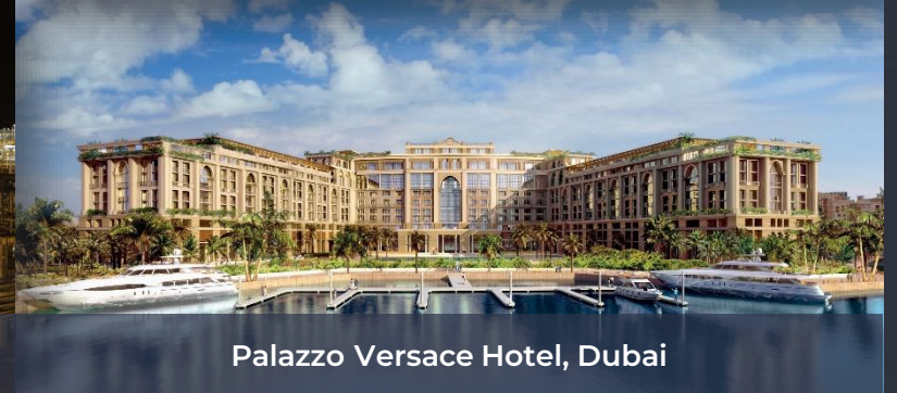
Palazzo Versace Hotel, Dubai