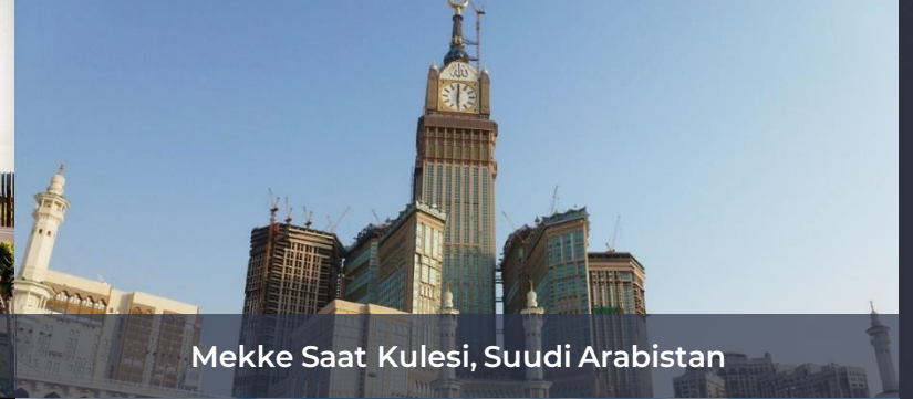
Mekke Saat Kulesi, Suudi Arabistan