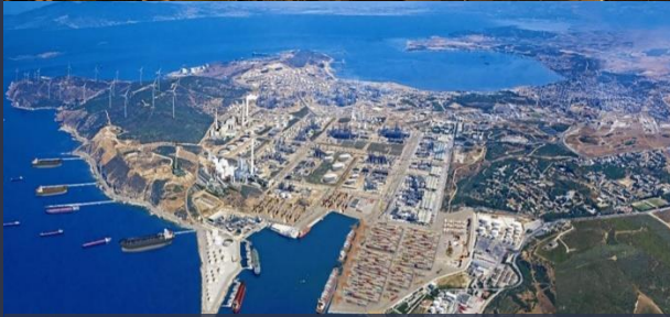
Socar – Star Rafineri, İzmir