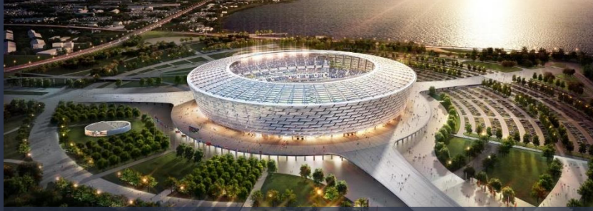
Bakü Olimpiyat Stadyumu, Azerbaycan