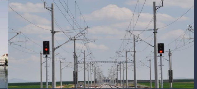
TCDD Alayunt-Afyon-Konya Projesi