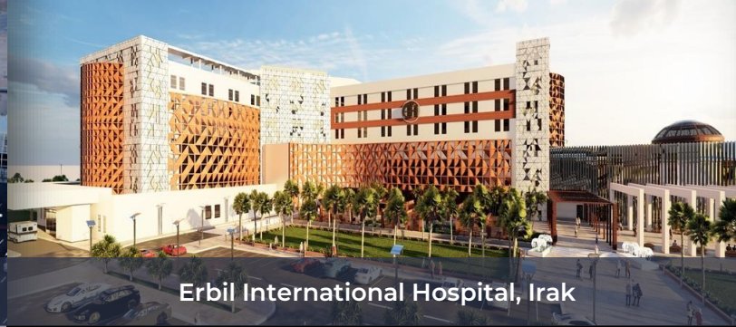
Erbil International Hospital, Irak