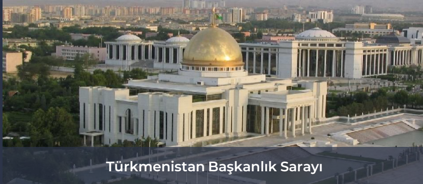
Türkmenistan Başkanlık Sarayı