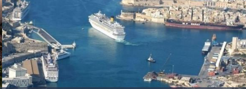
Port of Valetta, Malta