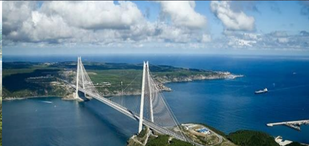
Yavuz Sultan Selim Köprüsü, İstanbul