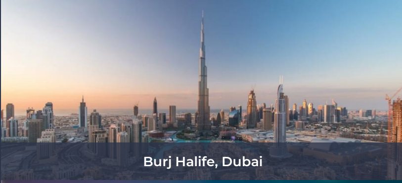
Burj Halife, Dubai