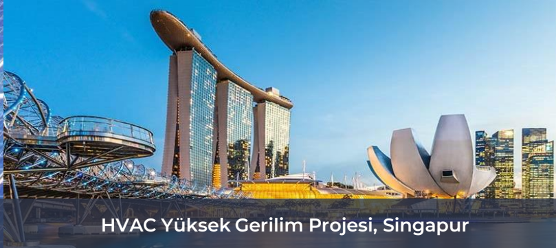
HVAC Yüksek Gerilim Projesi, Singapur