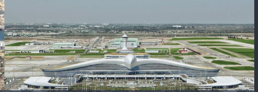
Aşgabat Havalimanı, Türkmenistan