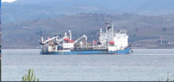
Çanakkale I,II,III ve İzmit Körfez Denizaltı Kablo Projeleri