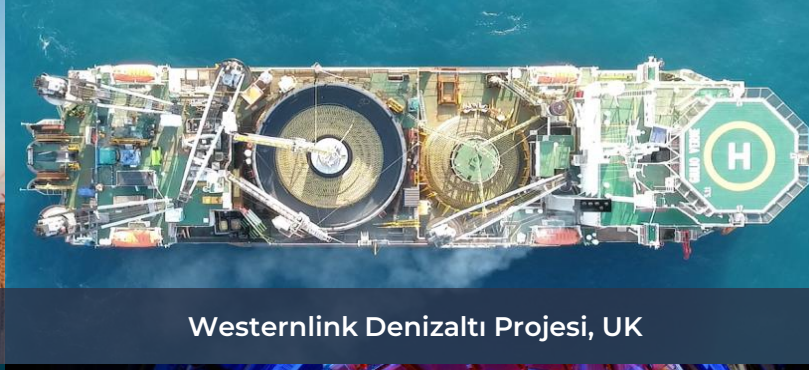
Westernlink Denizaltı Projesi, UK