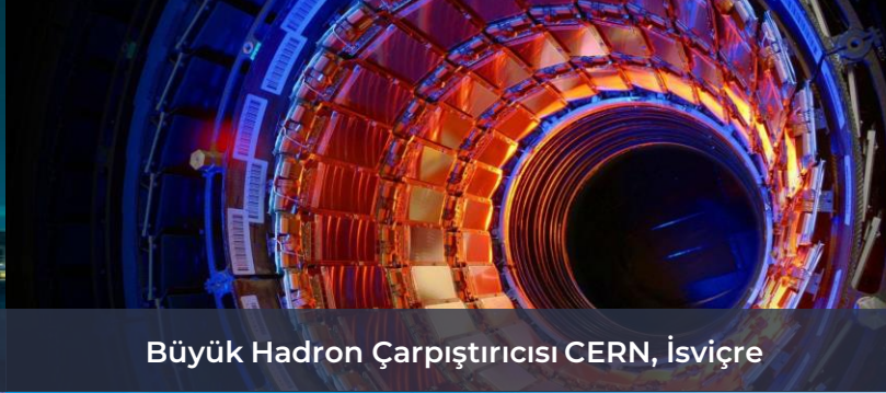
Büyük Hadron Çarpıştırıcısı CERN, İsviçre