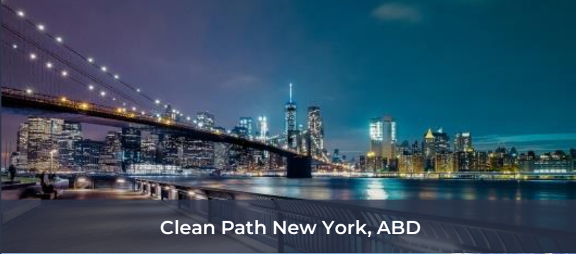
Clean Path New York, ABD