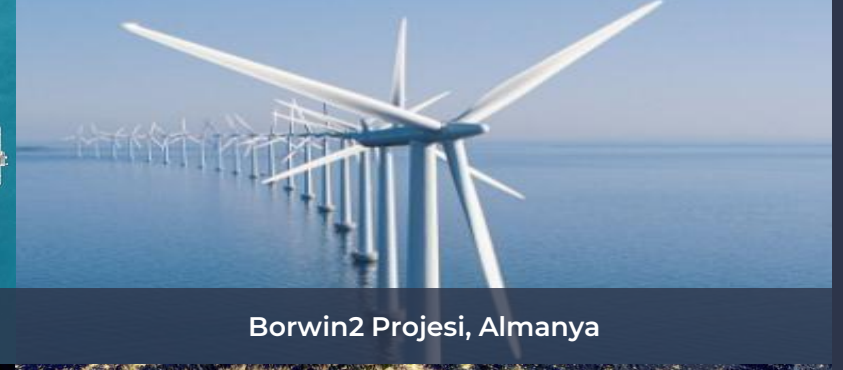
Borwin2 Projesi, Almanya