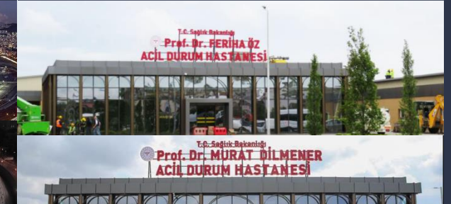
Sancaktepe, Yeşilköy Sahra Hastaneleri