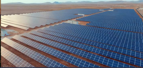
YEKA GES-1 Konya