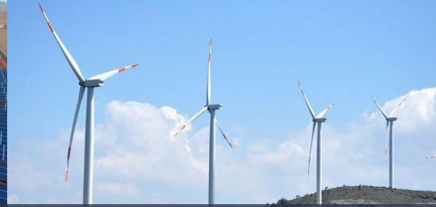
YEKA RES-2 Balıkesir, Çanakkale, Aydın, Muğla