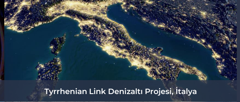
Tyrrhenian Link Denizaltı Projesi, İtalya