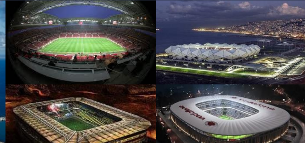
Dört Büyüklerin Stadyumları